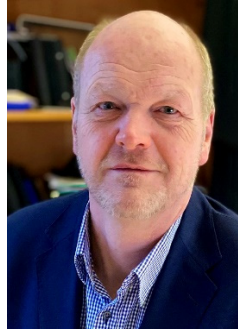
Dirk Jäger

Dirk Jäger, Superintendent des Kirchenkreises Hittfeld Stellvertretender Regionalbischof des Sprengels Lüneburg